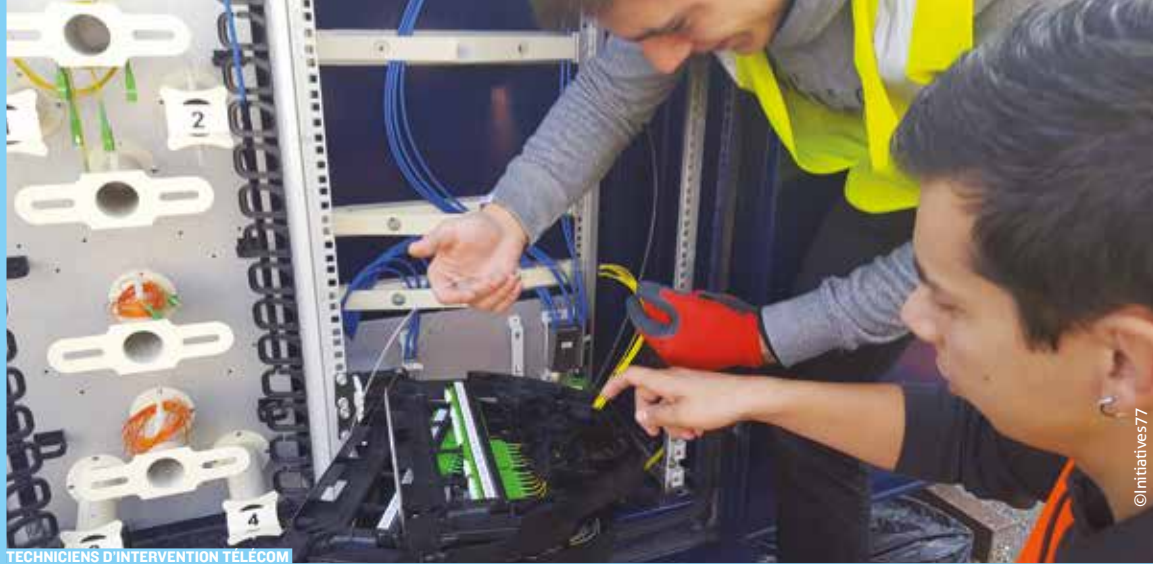
TECHNICIENS D'INTERVENTION TÉLÉCOM