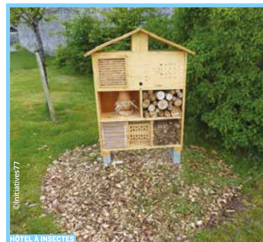
HÔTEL À INSECTES

Le Conseil départemental préserve la richesse de son patrimoine naturel. INITIATIVES77 contribue à gérer, protéger, aménager, ouvrir au plus grand nombre, des sites remarquables sans les dénaturer.